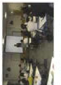
中国語講座、英語の歌に二回の高学年が参加しました。