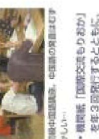
中国語講座、英語の歌に二回の高学年が参加しました。