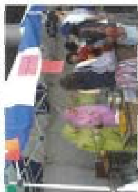
アジアの舞台村では7カ国が出店しました。

した。アジア圏の留学生が母国の料理を市民に振舞いながら、市民との交流を深めました。