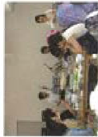
中国語講座、英語の歌に二回の高学年が参加しました。