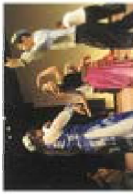
協会設立15周年記念イベントで国際理解が深められました

協会設立15周年を迎え、記念イベントを開催するなど、多くの市民に当協会を周知することができました。