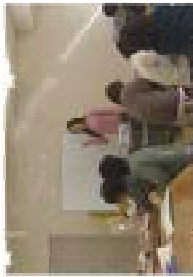
国際交流講座。講師の文化に触れながら、参加者で思いやりなどを学びました

◆国際交流講座「国際交流もりおか」を年3回発行するとともに、外国人向けに3カ国語生活情報紙「もりおか」を年4回発行し、日常生活に役立つ情報を提供しました。