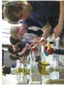
ビクトリアハイスクールの生徒がけしめ給付に開催中

◆ビクトリア市高校生受入れ ビクトリアハイスクールの生徒一行が5月8日から12日まで来盛し、下小島中学校と盛岡工業高校で研修体験しました。