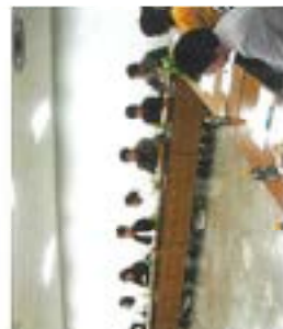
上田西丁団体内の皆さんと、新学生が飯沼への遠征や日ごらのつどいの森について自由討議しました