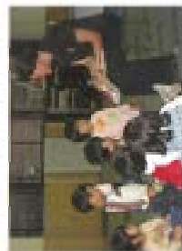
子どもたちに馴染み深い漫画やキャラクターが楽しく英語に触れてもらいました

幼児が楽しく遊びながら、異文化への理解を深めるとともに、コミュニケーション能力を身につけることを目的に10月7日と2月3日に開催しました。