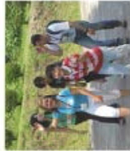
いばらきのなか、飯沼つどいの森でのハイキングへ出発!

指定したテーマの中から作文を応募してもらい、第一次審査の作文審査を経て、7月10日に第二次審査のスピーチ審査を開催し、最優秀賞と奨励賞等を決定しました。