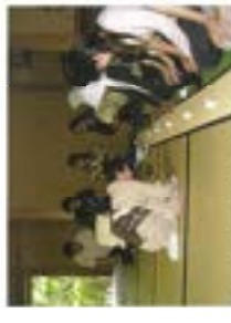
日本文化体験講座では茶道とお茶会を体験しました。お茶のお話も?

◆ビクトリア市サッカーチームの受入れ 8月にビクトリア市からアンダー15のサッカーチーム一行が来盛し、中学生のサッカーチームなどと交流試合をしました。また、さんま園りのパレードに参加したり、大相撲の遠見を見学したりしました。