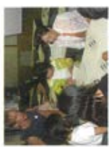
通訳ボランティア研修会の開催はすべて英語です!

研修団が10月15日から22日までの8日間、姉妹都市のカナダ、ビクトリア市で海外研修を行いました。ホームステイによる生活体験やホスト校での授業体験等をたくさん経験してきました。