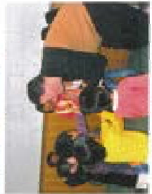
盛岡市でかけ通訳ガイド養成講座では盛岡の情報を広めることと英語を楽しみました