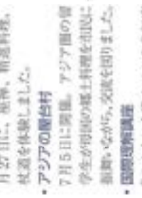
日本文化の習得を体験中。心算にして精神統一を深めます。