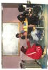
若手通訳センターで通訳に訪れた大連市で通訳のスキルを体験しました