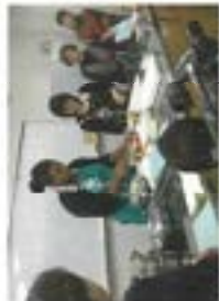
カリブアン料理を体験。ほかに、調理の仕方やバルバドスの文化を学びました。