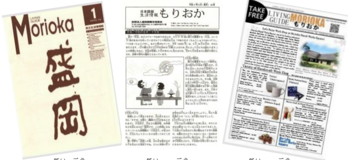
だい こう 第1号

じょうほう し きぼう 「こんな情報が知りたい」という希望があれば、ぜひ、私たち盛岡国際交流協会に教えてください。 もりおか こんさいこうりゅうきょうかい おし さい。