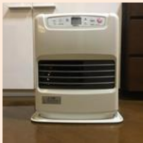
石油ファンヒーター