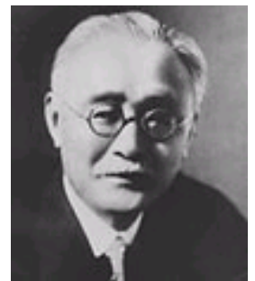
新渡戸稲造 博士 Dr. Inazo Nitobe

盛岡市で生まれ育ち国際連盟事務次長を務めた新渡戸稲造博士が、カナダのバンフで行われた太平洋問題調査会議に出席後ビクトリア市にある「ロイヤル・ジュビリー病院」で亡くなりました。新渡戸博士の生誕の地と終焉の地という縁がきっかけで、1985年5月23日（カナダ時間）に姉妹都市を提携しました。