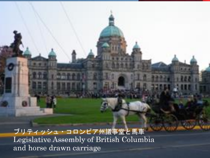
ブリティッシュ・コロンビア州議事堂と馬車 Legislative Assembly of British Columbia and horse drawn carriage

盛岡市で生まれ育ち国際連盟事務次長を務めた新渡戸稲造博士が、カナダのバンフで行われた太平洋問題調査会議に出席後ビクトリア市にある「ロイヤル・ジュビリー病院」で亡くなりました。新渡戸博士の生誕の地と終焉の地という縁がきっかけで、1985年5月23日（カナダ時間）に姉妹都市を提携しました。