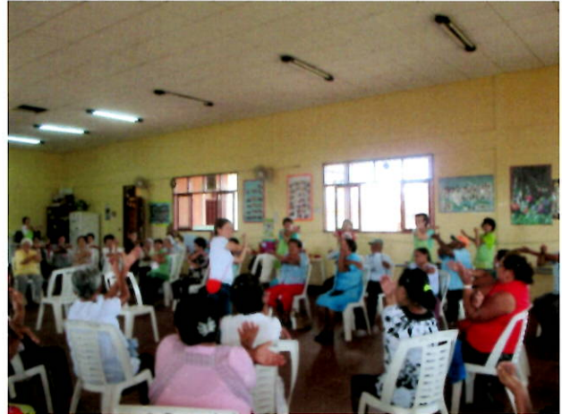
日系人とボリビア人デイサービスの交流会