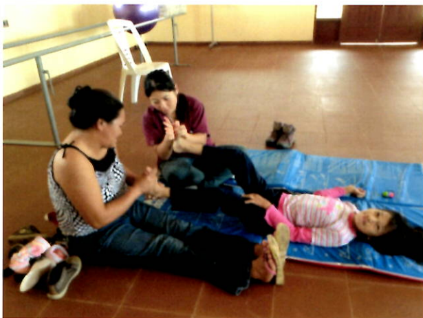
患者さんのご家族への指導風景

こちらの地域は、理学療法士をはじめリハビリ関連職種がないため、患者さんに対し理学療法を提供するとともに、ご家族やスタッフに運動の方法を教えています。また、妊婦体操を指導したり、介護予防のための運動を高齢者デイサービスで行っています。日本のように、健康保険制度や健康診断制度が整っておらず、また大きな病院で医療を受けることも難しい現状から、病気を予防する健康づくりがとても重要だ