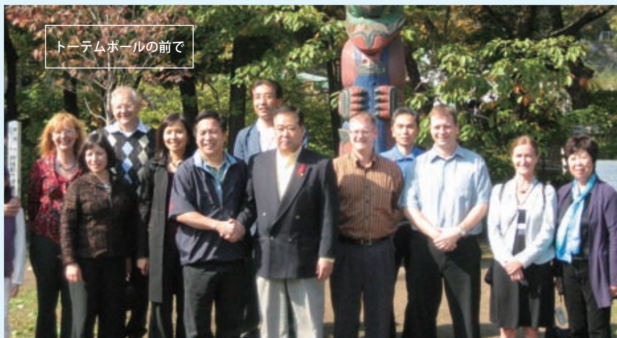
トーテムポールの前で