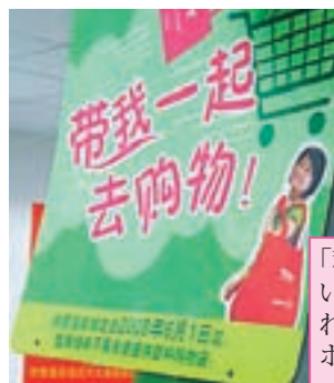
「私を連れて一緒に買い物しよう！」と書かれたエコバック推奨ポスター

有料となりました。私の母は、時折、エコバックを持参するのを忘れます。そうすると、その時にレジ袋の料金を払わなければならないため、買い物するのをやめてしまうこともあるそうです。レジ袋の料金、4.90人民元（約60円）は中国の人にとっては結構高く感じる値段です。