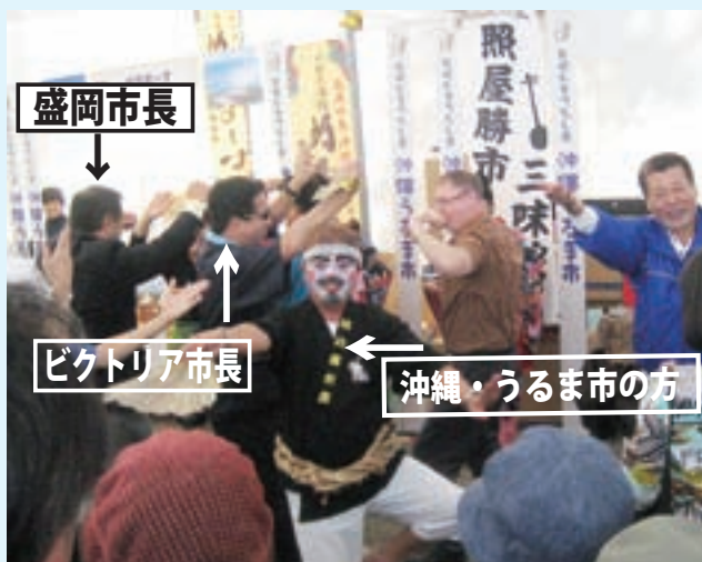
沖縄の三味に合わせて踊る盛岡、ビクトリア両市長。 盛岡・ビクトリア市に加えて、沖縄・うるま市の三都市交流ですね。（全国朝市サミットで）