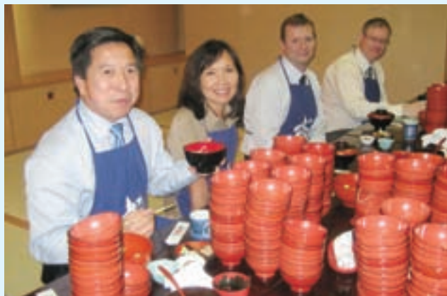
わんこそばの昼食をとるビクトリア一行。 アラン・ロウ市長は、なんと110杯以上もたいらげました。