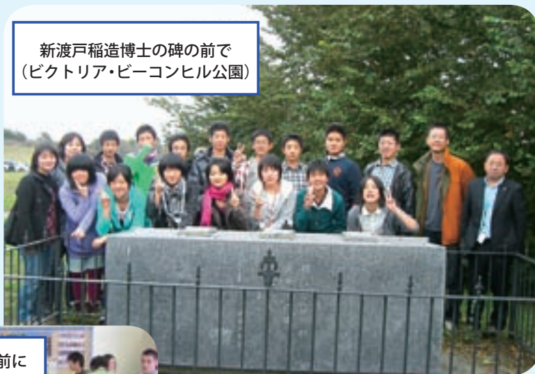
新渡戸稲造博士の碑の前で (ビクトリア・ビーコンヒル公園)