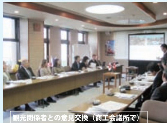
観光関係者との意見交換（商工会議所で）

盛岡市の姉妹都市であるカナダ・ビクトリア市の市長夫妻をはじめとする親善訪問団8人が10月16日（木）から20日（月）まで盛岡を訪れました。